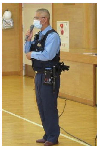
地域課 巨摩駐在所 原 巡查部長